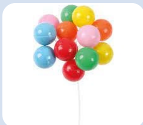
Probleem plastic ballonnen die niet herbruikbaar zijn