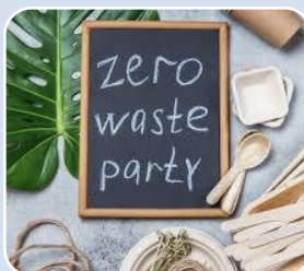
Oplossing : reclame maken voor zero waste party's, dus met bijv. stoffen duurzame slingers, gewone borden in plaats van plastic borden en bestek.